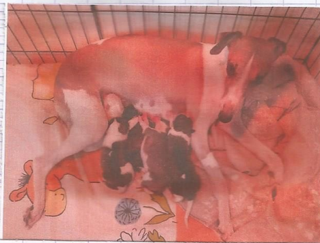
Les cinq bébés ensemble