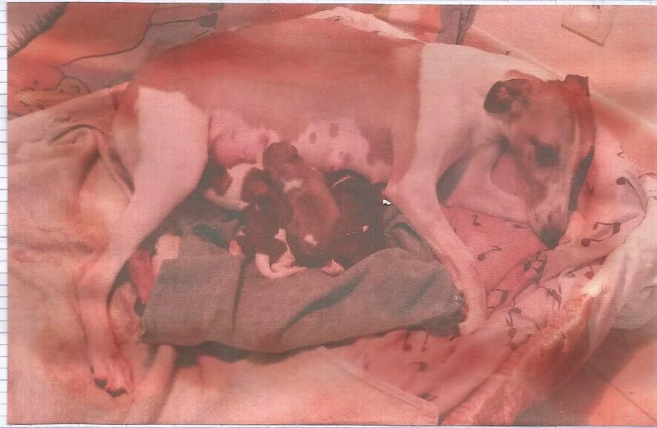
Les trois bébés sorti par voie naturel